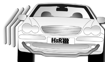
Mit H&R Stabilisator/ with H&R Stabilizer