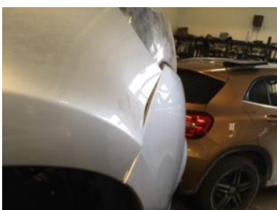
Foto Kotflügel 16 Zoll Typ mit Stoßfänger 15 Zoll Typ

Some 15 "models are supplied with parts of 16" In case of doubt, it is easy to check: Printed number in the front wing Number 185: type 15 " Number 195: Type 16 "